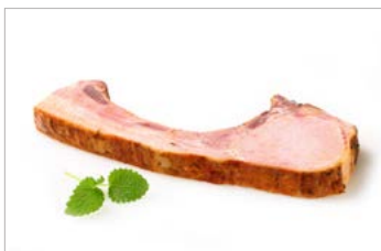
VARKENSNOTE A L'OS